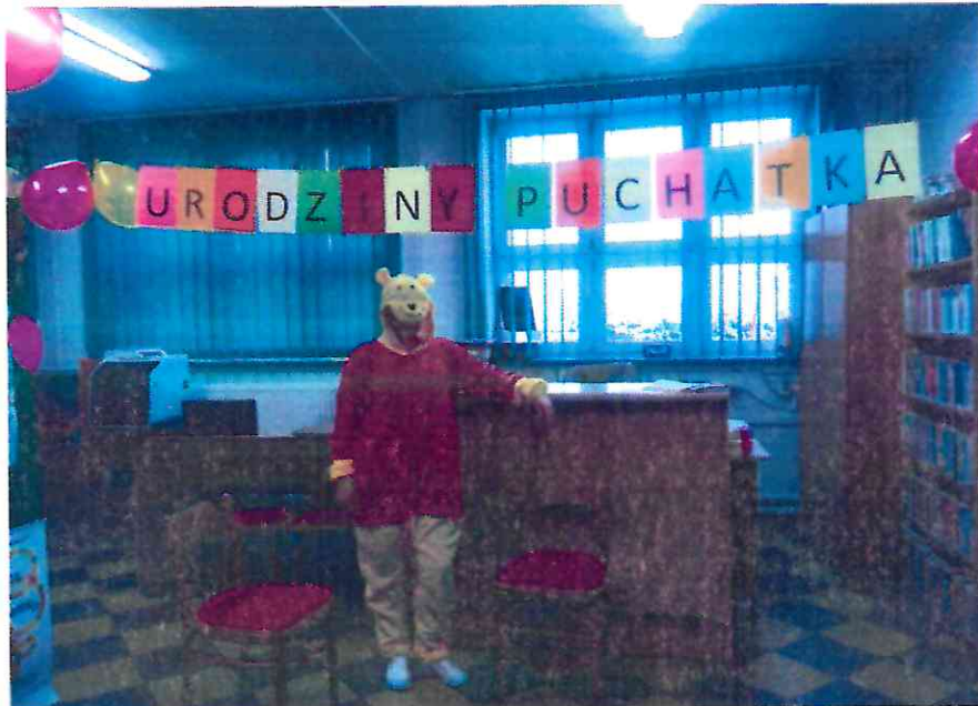
opracowanie Marlena Przybysz

Biblioteka organizuje cykliczne coroczne akcje np. Urodziny Kubusia Puchatka w dniu „ Święta Pluszowego Misia ”