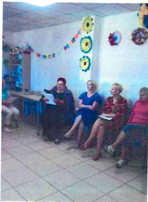
opracowanie Marlena Przybysz