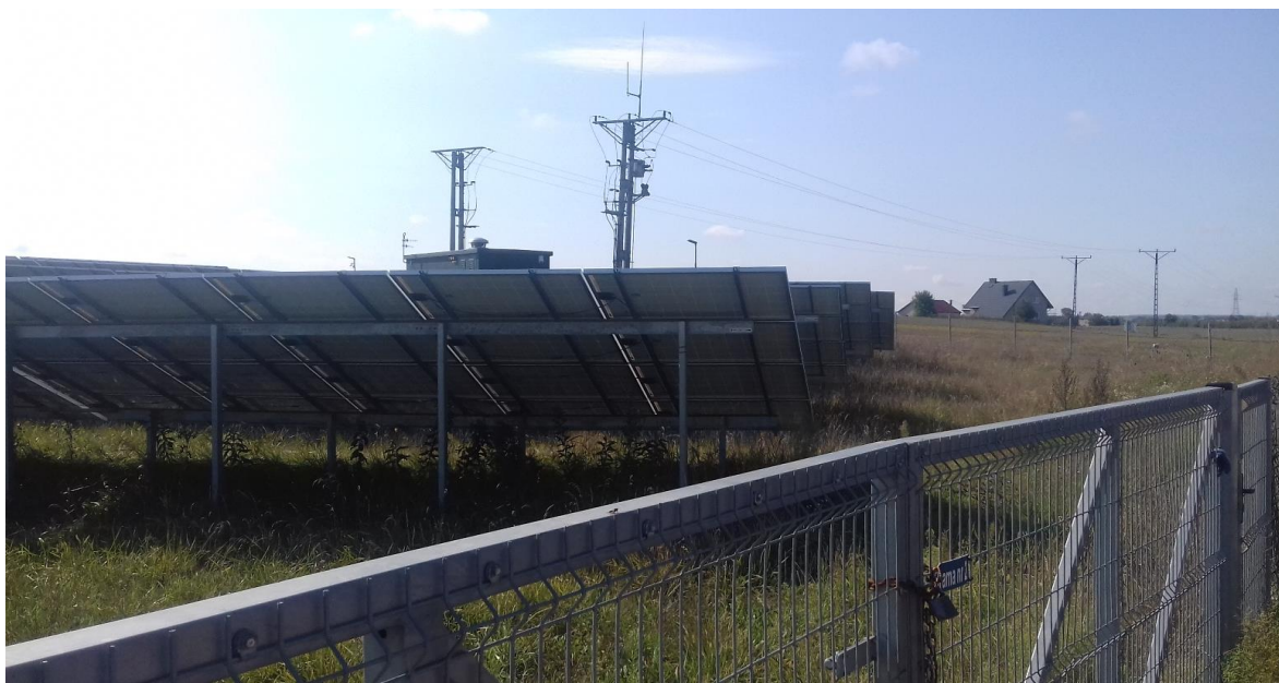
Zdjęcie. Przykładowe ogrodzenie wraz z systemem alarmowo – monitoringowym na farmie PV pod Lublinem (M. Szlaps)