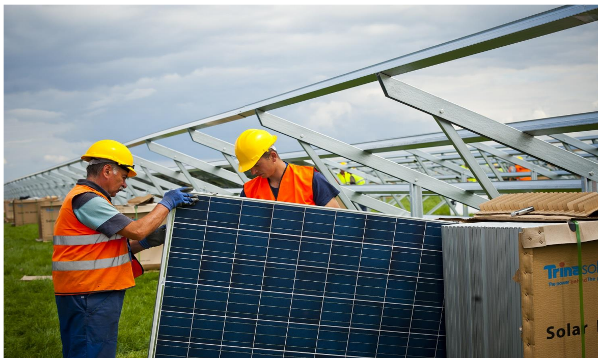
Zdjęcia. Budowa farmy solarnej Bautzen (Niemcy) 38MW na powierzchni ok. 70ha przez polską firmę Remor Solar z Recza

Ogniwa fotowoltaiczne pracują bezobsługowo. Montaż odbywa się w miejscu posadowienia z gotowych elementów bezpośrednio na gruncie. Montaż obejmuje wbicie (bądź wkręcenie) do gruntu konstrukcji mocujących w formie metalowych słupków, do których przykręcane są panele fotowoltaiczne, podłączane są przetwornice, inwertery i inne urządzenia wspomagające pracę ogniw. Panele fotowoltaiczne oddają ciepło przez konwekcję naturalną do przepływającego powietrza atmosferycznego. Jest to jedyny i w pełni wystarczający system chłodzenia. Nie przewiduje się montażu wentylatorów. Inwertery chłodzone są w ten sam sposób. Planuje się minimum 29-letni okres eksploatacji instalacji.